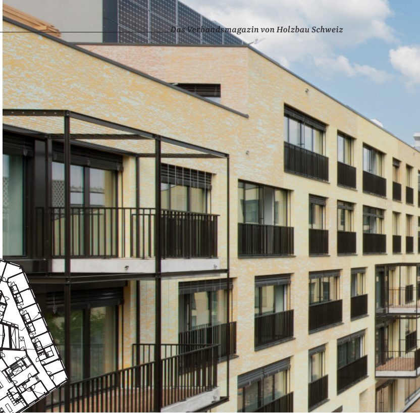
Der Grundriss 2. OG zeigt die Gesamtsituation mit Innenhof.