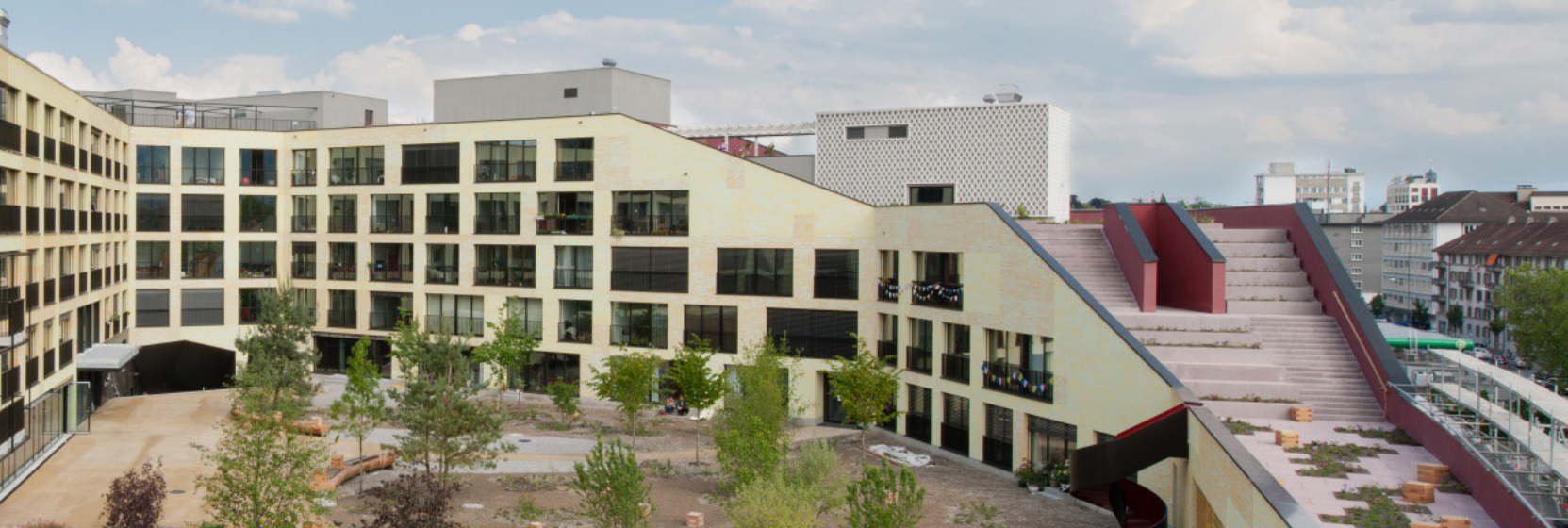
Die 2014 fertiggestellte Überbauung Kalkbreite ist ein spannendes Grossprojekt, das verschiedene Lebensbereiche mit einem hohen Grad an Vernetzung, Flexibilität und Modularität vereint.