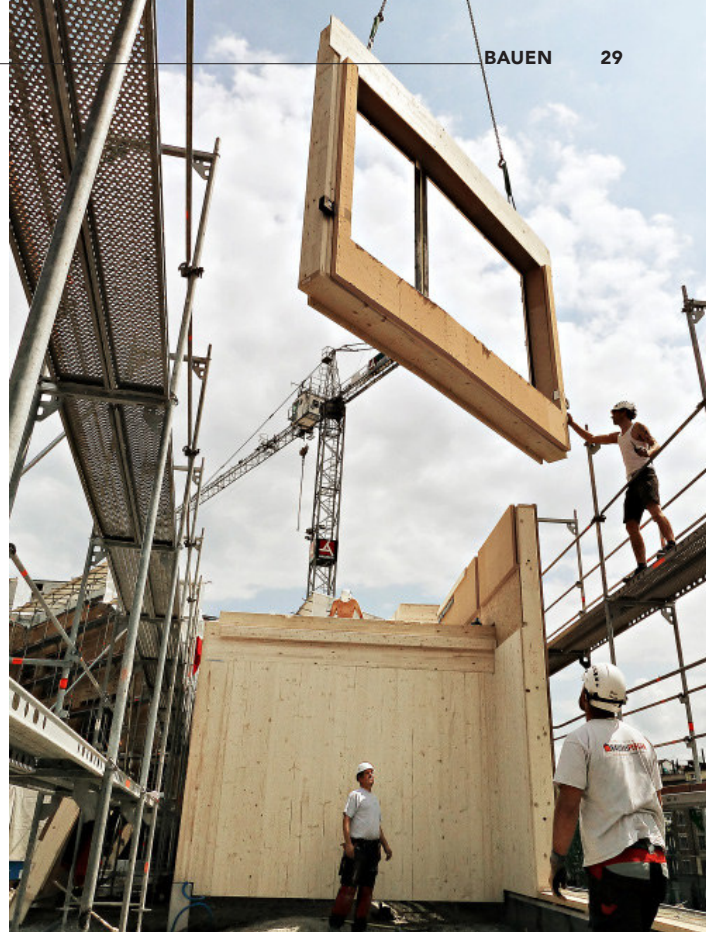
Die Anlieferung für die Montage der Holzelemente für die Aussenwand musste just in time erfolgen.